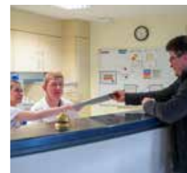
Station – Ebene 6 OP, vorbereitende Sprechstunde Anmeldung am Stationstresen